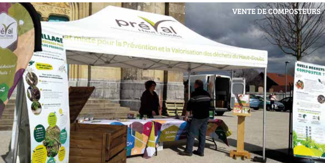
VENTE DE COMPOSTEURS