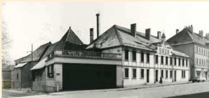
Distillerie de la Suze, vers 1972

En 1923, une succursale de cette société dont le siège social est situé à Maisons-Alfort (Seine) s'installe à Pontarlier, 4 place des Bernardines. Les statuts publiés dans la presse locale le 22 décembre 1923 indique que la société a pour objet "L'industrie