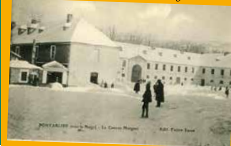
Casernes Marguet - 4F167

RÉSERVATION OBLIGATOIRE (PLACES LIMITÉES)