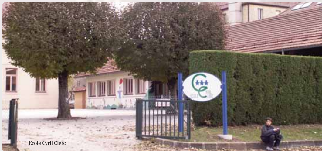
Ecole Cyril Clerc