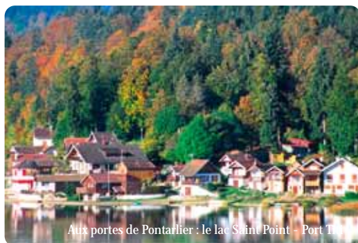
Aux portes de Pontarlier : le lac Saint Point - Port T

Plus d'informations sur www.pontarlier.org