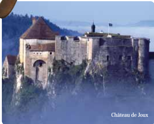
Château de Joux

Ville capitale de l'absinthe pendant plus d'un siècle, Pontarlier est aussi une ville du vitrail : ceux d'Alfred Manessier transpercent de lumière les vieilles pierres de l'église Saint Bénigne, ceux de Claude Laurent François, église Saint Pierre, relient les mondes extérieurs et intérieurs tandis que ceux du Musée nous font glisser dans un univers floral.