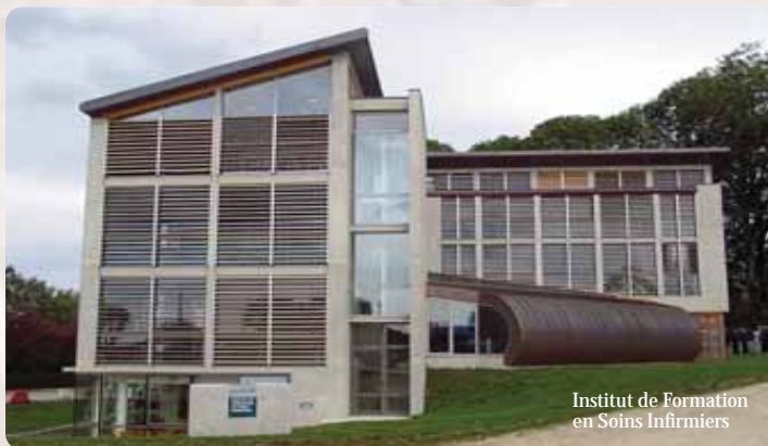
Institut de Formation en Soins Infirmiers

Avenue du Général Girod Tél. 03.81.38.53.29 Fax 03.81.38.58.42