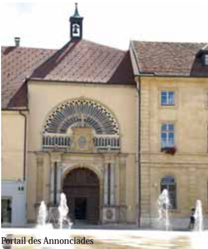
Portail des Annonciades

Les Casernes Marguet datant du 18 ème siècle rappellent que Pontarlier fut une ville de garnison. En fait, hormis quelques éléments épars des 17 ème et 18 ème siècles, voire du 15 ème au Musée, Pontarlier est une ville du 19 ème . En témoignent de nombreux édifices.