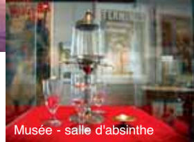
Musée - salle d'absinthe

La Ville de Pontarlier vous propose tout au long de l'année de nombreuses manifestations parmi lesquelles notamment :