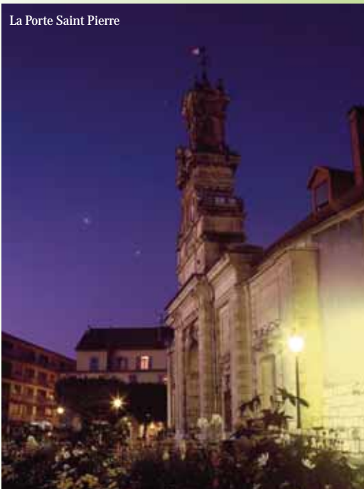
La Porte Saint Pierre