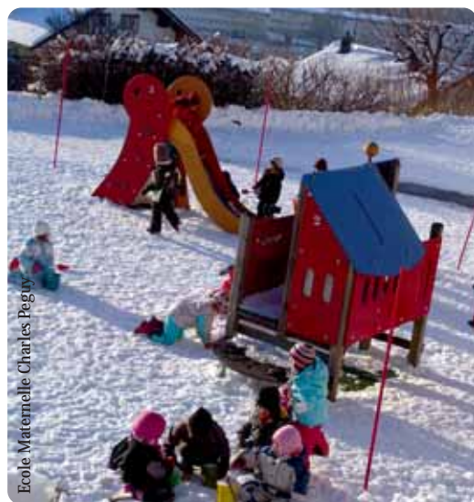
Ecole Maternelle Charles Peguy

De la maternelle aux classes de BTS ou de l'IFSI (Institut de Formation en Soins Infirmiers), le jeune Pontissalien peut parcourir son cursus scolaire sans être obligé de s'expatrier et de renoncer à des conditions particulièrement favorables à son équilibre et à son épanouissement.