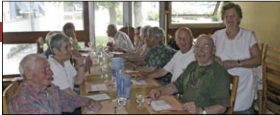
Restaurant des Capucins

> le restaurant des Capucins est ouvert du lundi au samedi , à partir de 12 heures, pour les personnes âgées qui souhaitent faire de leur déjeuner un moment convivial avec d'autres personnes.