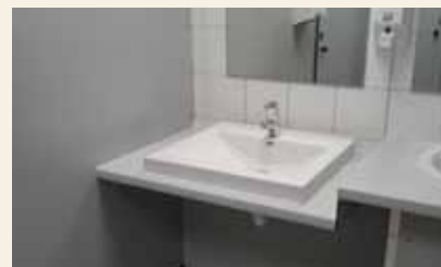
Modification des sanitaires