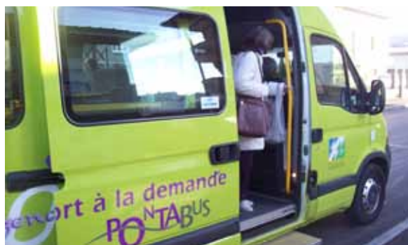
Vers une ville accessible à tous