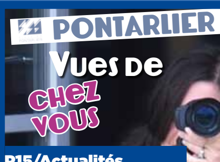
P15/Actualités Concours photos 2013