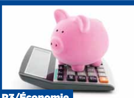
P3/Économie Budget 2013