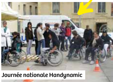
Journée nationale Handynamic

Enfin, des journées de sensibilisation aux différentes formes de handicap sont régulièrement organisées à destination de la jeunesse ou du grand public.