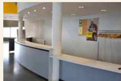
Mise en accessibilité de l'espace billetterie