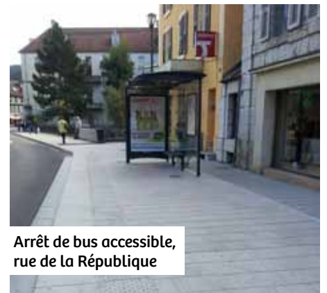
Arrêt de bus accessible, rue de la République

de voirie, 12 arrêts de bus ont été rendus accessibles (rues Auguste Junod, Arthur Bourdin, Marpaud, du Toulombief, du Crêt, des Lavaux [3], de la République, de Baumont, de Morteau et aux Étraches). La lisibilité des noms des arrêts (écriture blanche sur fond noir) ainsi que des plans et horaires a déjà été améliorée. En 2013, Keolis Urbest proposera une annonce sonore des arrêts dans les bus.