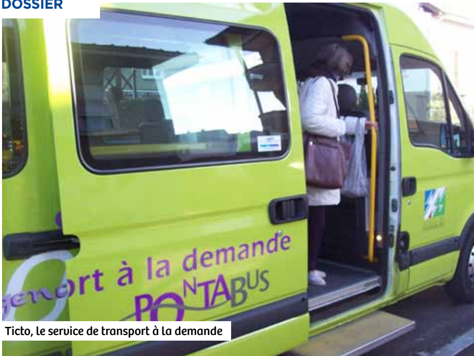
Ticto, le service de transport à la demande