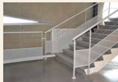
Prolongement des mains courantes