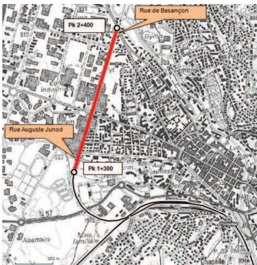
Linéaire d'emprise ferroviaire rectifié concerné par le projet de transfert de gestion

La section à transférer court du point kilométrique 1+300 (estimé au nord du tunnel ferroviaire vers la rue Auguste Junod) au point kilométrique 2+400 (estimé au niveau de la rue de Besançon).