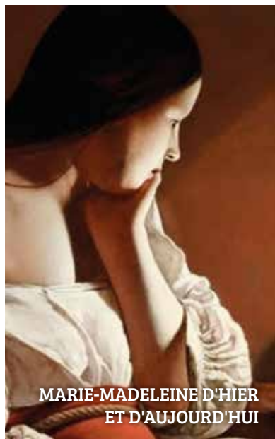
MARIE-MADELEINE D'HIER ET D'AUJOURD'HUI