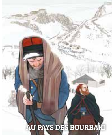
AU PAYS DES BOURBAKI

🕒 LA CHAPELLE DES ANNONCIADES de 10h à 18h. Tarif : entrée libre. Le Lotus Vert : 06 83 32 39 80 06 83 32 39 80 - jerome. maitre@orange.fr