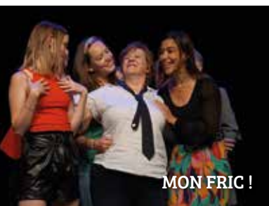
MON FRIC !

Théâtre/Ouvert : 06 86 45 35 16 ass.theatrouvert@gmail.com www.theatrouvert.fr - Suivez-nous sur Facebook et twitter