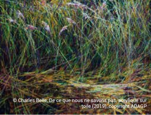
© Charles Belle, De ce que nous ne savons pas, acrylique sur toile (2019), copyright ADAGP